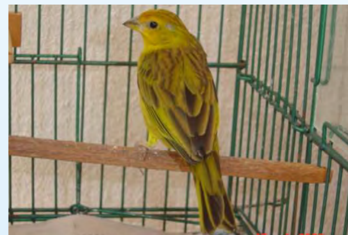
Fêmea normal região central