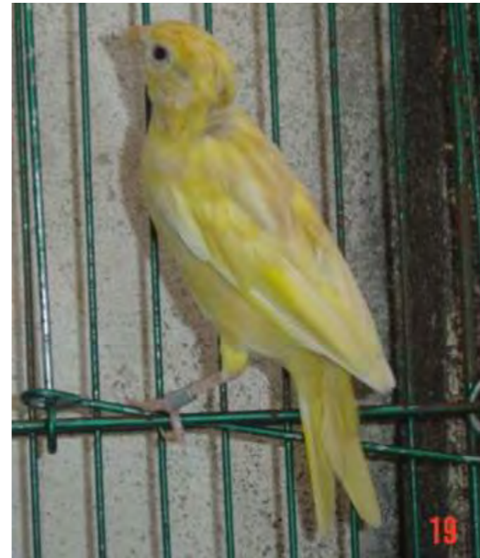
Feo oxidada fêmea região central

1. Feos oxidados Pelo fato das feo-melaninas se manifestarem principalmente nas bordas das penas, nos pássaros “oxidados” o desenho apresenta uma “escamação” nítida de tonalidade marrom claro.