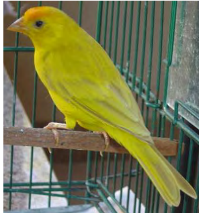
Macho isabelino pastel região central

Característico da região julgada. Nos exemplares da região sul, peito mais proeminente e cabeça levemente menor. Nos exemplares da região central corpo levemente mais estilizado. Nos exemplares da região norte porte algo maior.