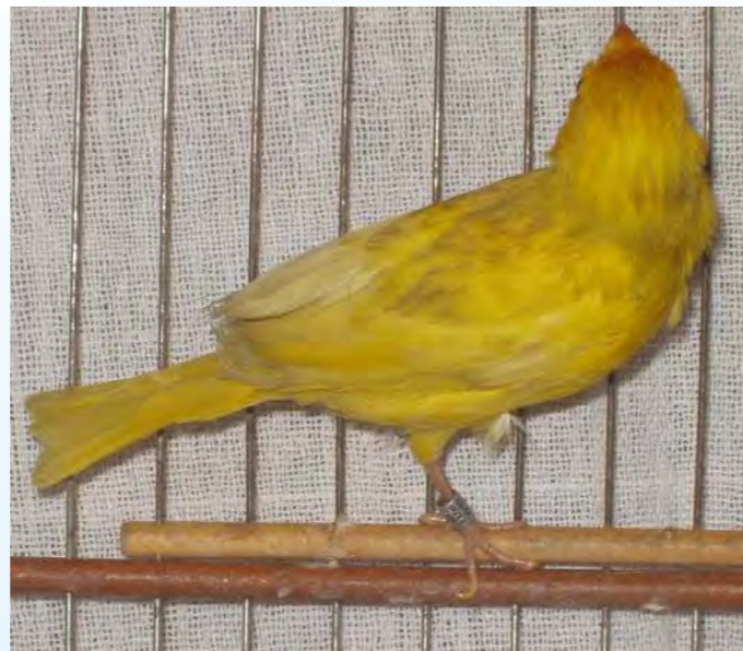
Macho canela opalino região central com boa oxidação melânica