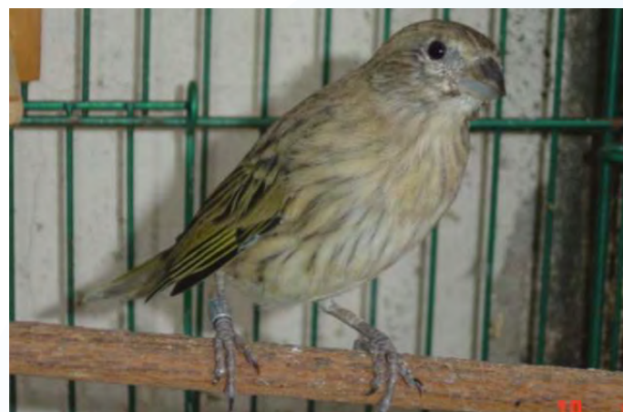
Fêmea normal do sul

Os exemplares sicalis do sul têm uma maior expressão melânica na sua plumagem, e menor quantidade de lipocromo nos machos. As fêmeas têm como particularidade a total ausência de lipocromos amarelos, sendo assim a sua cor de fundo branca (ausência de lipocromos).