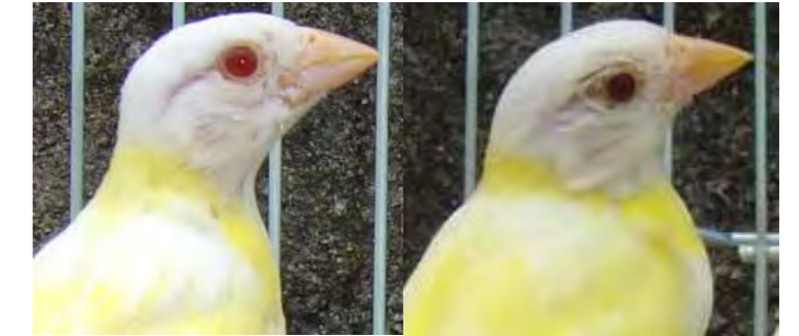
Filhotes feo diluído origem canela (esq) e origem normal (dir)

A incidência da mutação feo nos sicalis normais, manifesta as características melânicas da plumagem, porém, mantém os olhos pretos, enquanto que quando presente nos sicalis canelas, o olho se mostrará vermelho.