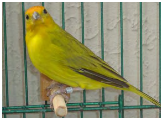
Macho normal região central

Na região central, ambos os sexos apresentam depósitos de lipocromos, sendo que existe (dependendo da região) um leve dimorfismo, sendo os machos levemente mais amarelos do que as fêmeas. Em alguns casos nota-se leves vestígios de uma coroa no alto da cabeça, próximo do bico, de tonalidade laranja.