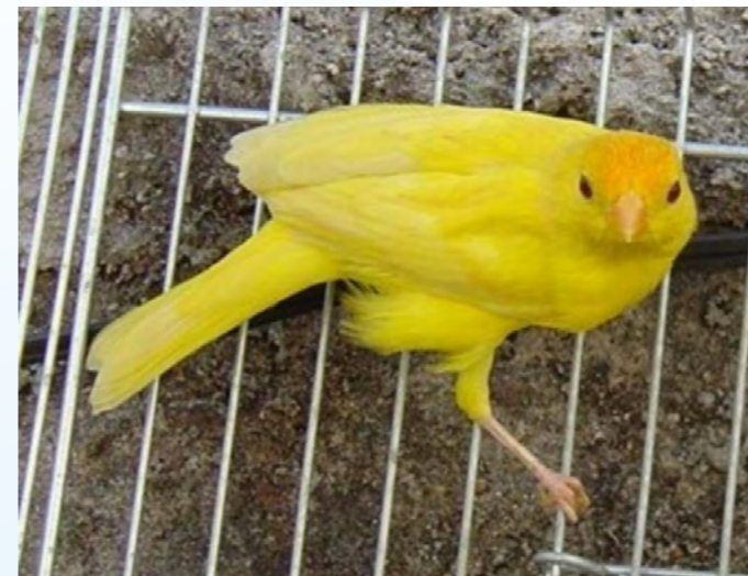
Feo diluído macho região central

2. Feos diluídos nos “diluídos” aparecem leves vestígios de melanina, com tonalidade bege muito clara.