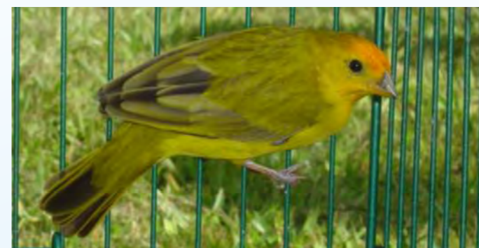
Macho normal região central

Valorizam-se os exemplares que apresentem a máxima expressão melânica, com reduzida manifestação de feo-melanina e desenho o mais nítido possível.