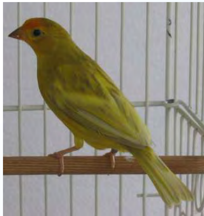
Macho verde opalino região central com excelente oxidação