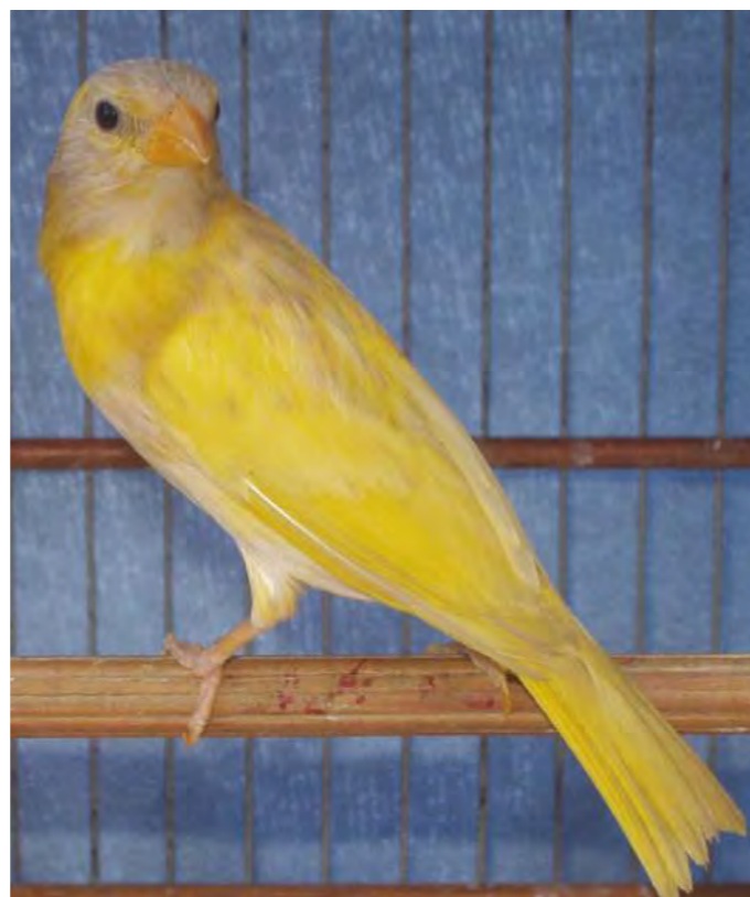
Macho canela opalino região central com menor expressão melânica

Presença de melanina marrom clara em toda a plumagem com concentração na ráquis das penas de tonalidade marrom mais escura.