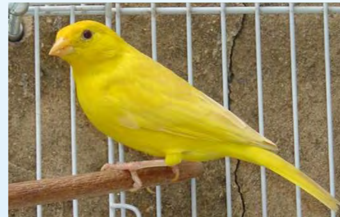
Feo diluído fêmea região central

A incidência da mutação feo nos sicalis normais, manifesta as características melânicas da plumagem, porém, mantém os olhos pretos, enquanto que quando presente nos sicalis canelas, o olho se mostrará vermelho.