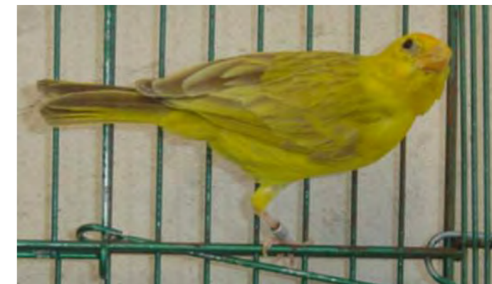
Fêmea canela região central

A mutação canela, transforma as eu-melaninas negras em eu-melaninas marrons. Valorizam-se os exemplares com maior expressão eu-melânica, mínima expressão de feo-melanina e desenho o mais nítido possível.