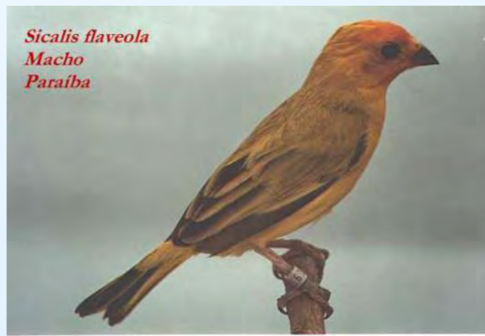
Sicalis flaveola Macho Paraíba

Por esse motivo, e para efeitos de concurso e julgamento, serão divididos os exemplares em sicalis de cor do sul (julgamento de