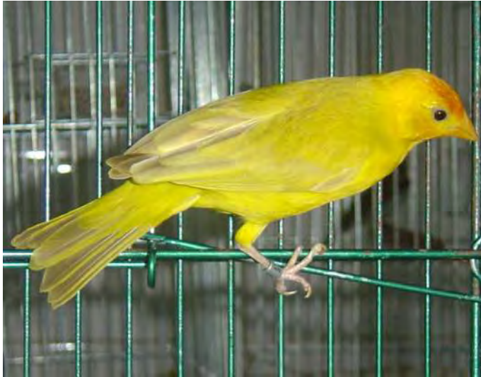
Macho canela pastel região norte

A mutação pastel nos sicalis canela tem um efeito diluidor e distribui as melaninas de forma a reduzir sensivelmente o desenho dorsal. As penas das asas e cauda apresentam em alguns casos bandas mais claras fruto de uma maior redução da expressão melânica. Valoriza-se os exemplares que apresentam o maior teor de melanina porém com excelente distribuição, com o mínimo possível de estrias dorsais.