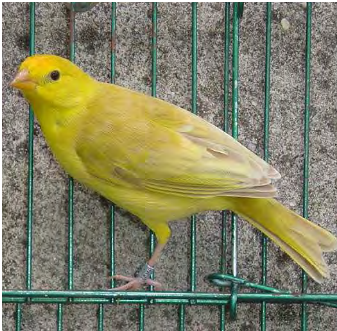
Fêmea canela pastel região central